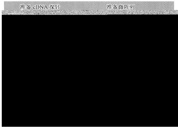
图 1 cDNA Microarray 技术示意图

样本的 mRNA 也转录为 cDNA ,并以绿色 Cy5 荧光标记. 混合以后与 cDNA 阵列上的探针进行杂交, 然后扫描检测两种荧光强度. 通常以 \log(Cy5/Cy3) 作为目标的表达水平值, 如图 1 所示.